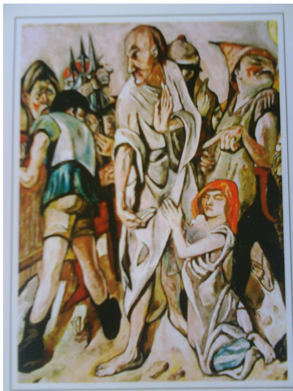
„Ježiš a cudzoložnica“